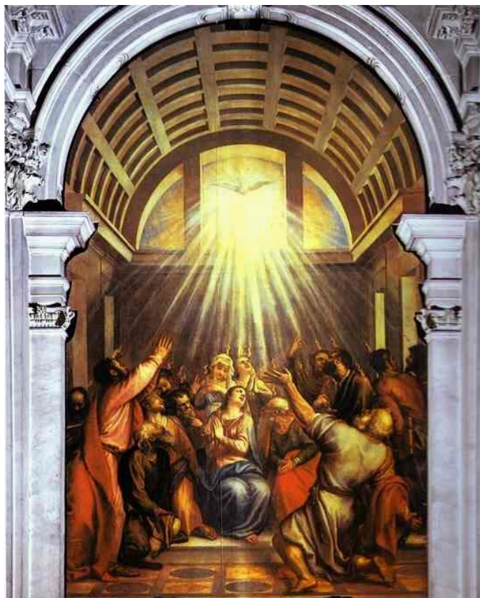
Cud zesłania Ducha Świętego, Tycjan 1545, bazylika Santa Maria Della Salute w Wenecji

Na podstawie www.pallotyni.pl/liber-mortuorum Opracował Zygmunt Lesiewicz